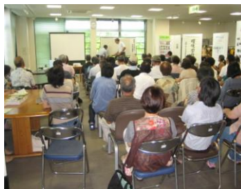
環境学習会：家庭から出る生ゴミ・雑草の堆肥化