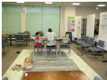
親子竹笛製作風景