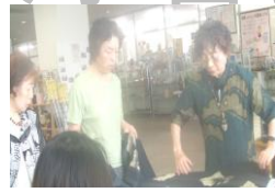
和服のリフォーム